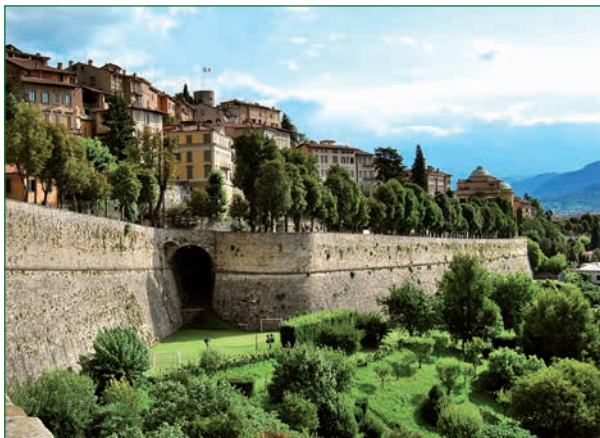
Bergamos Città Alta, der historische Kern der Stadt, ist vollständig von einer Stadtmauer umgeben.

Im Anschluss setzen Sie die Fahrt in Richtung Osten fort. Vorbei an Brescia und dem Gardasee – Teil der Oberitalienischen