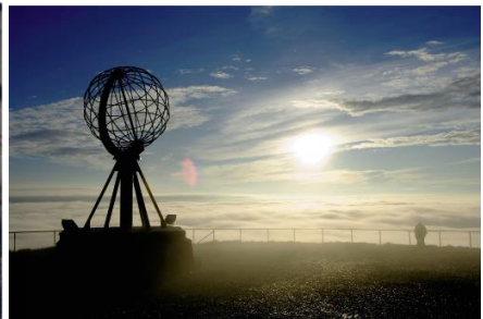
Bilder von links nach rechts: © Franziska Hidber / © Norway photo bank / © Kontiki Reisen