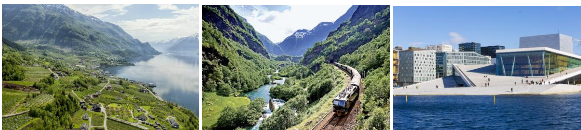
Bild von links nach rechts: © Hardangervida, Niels Johansen / © Flam Bahn / © Oslo Oper, Norway photo bank

Auf der Bootsfahrt durch den schmalen Nærøyfjord fahren Sie vom Flåmstal nach Gudvangen. Die spektakuläre Fjordroute zählt zum UNESCO Weltkulturerbe. Im Anschluss besuchen Sie einen lokalen Obstbauernhof mit einer eigenen Schafzucht. Während der Führung erfahren Sie Wissenswertes über die Produktion und eine kleine Kostprobe darf natürlich nicht fehlen. Übernachtung und Abendessen in Ulvik. (F, A)