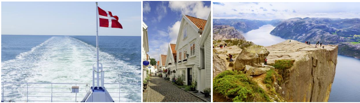
Bild von links nach rechts: © Fährüberfahrt / © Stavanger, Nightman1965, Shutterstock / © Preikestolen