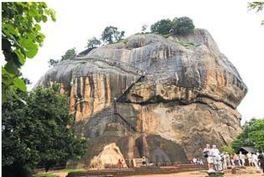
Stationen einer Hochland-Tour: Die Felsentempel von Dambulla, der Zahntempel von Kandy und die Felsenfestung in Sigiriya (von oben) gehören zu den wichtigsten Sehenswürdigkeiten.