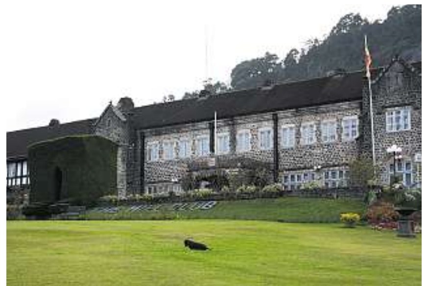
Der «Hill Club» in Nuwara Eliya: Einst trafen sich hier die englischen Kolonialherren zum Tee.